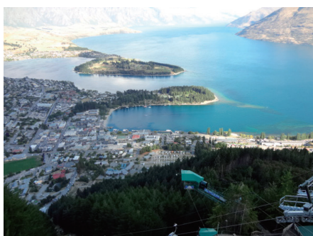
NZ クライストチャーチ