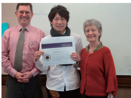
現地スタッフと一緒に