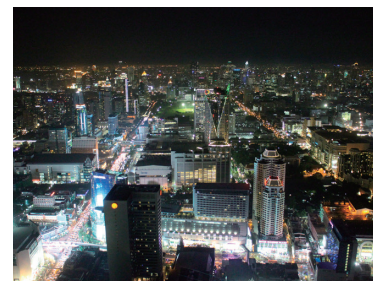
首都バンコクの夜景

タイは経済的にも発展してきており、人々の生活も豊かになってきています。ただし、解決しなければならない課題や貧富の格差、その他民族の問題など、様々な問題を抱えている国です。コンケン大学の研修後はバンコクを中心としたスタディツアーを実施します。人々の優しさにふれながら、様々な角度からタイの文化や社会、そして自分自身との関わりを考えていきます。