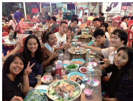
おいしいタイ料理