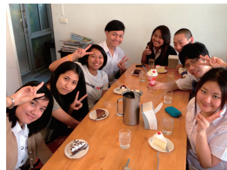
コンケン大学のカフェで チューターと交流