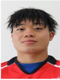
2年 饒辺 永尨斗 ヨヘン エイト コザ(沖縄) FL 168cm 72g